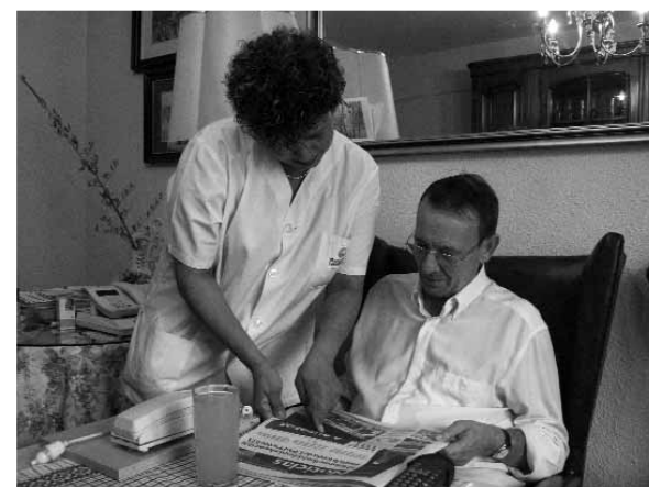
CASAS AMIGAS TRANSFORMA